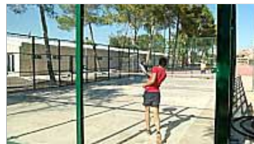
Dos jóvenes jugando en una de las pistas del nuevo polideportivo de Les Salines, que se inaugurará hoy oficialmente.

Sólo queda un objetivo pendiente, el complejo rural destinado a los turistas, que